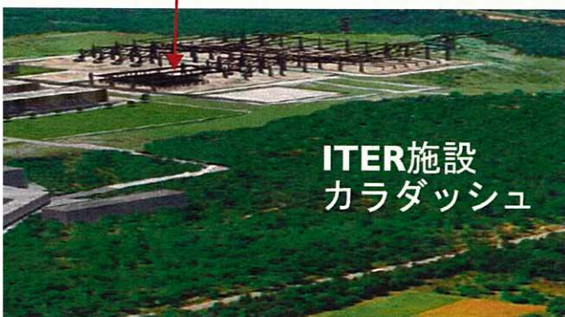
ITER施設 カラダッシュ